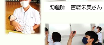
生徒は、命に尊さについて、再認識するよい機会となりました。