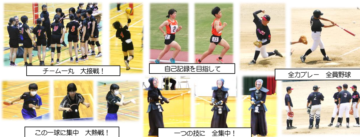
チーム一丸 大接戦!

さて、3年生は、3年間の集大成の場となる今大会に向けて、強い思いを持って取り組んできました。また、大会当日は、最後まで全力で競技・プレーする姿が、1・2年生の心に響いたことと思います。3年生、お疲れ様でした。さあ、次は1・2年生の番だ!