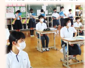
授業(3年)見学の様子