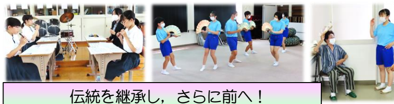
伝統を継承し、さらに前へ!