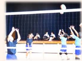
体育館での部活動見学の様子