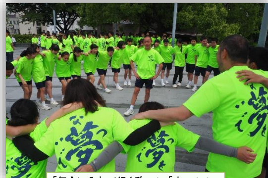
「気合い入れて行くぞ〜!」「オー!!!」