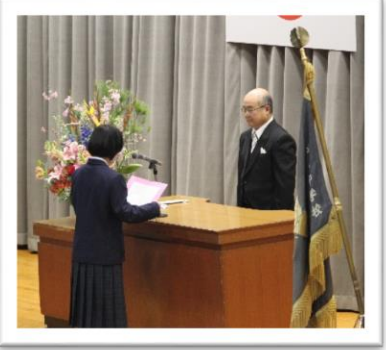
新入生代表決意の言葉