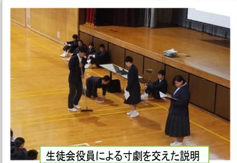
生徒会役員による寸劇を交えた説明