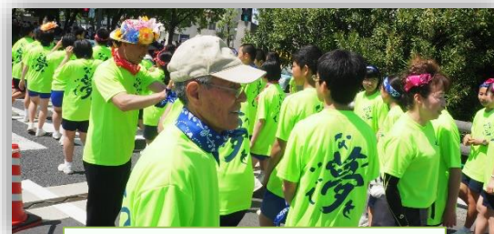
お世話になった皆様, ありがとうございます!