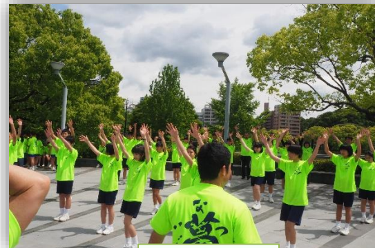
開始直前の最終確認