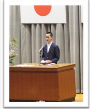
生徒代表歓迎の言葉