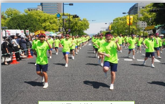
明るい世羅町を笑顔でアピール!