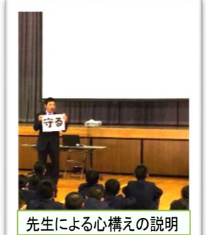
先生による心構えの説明