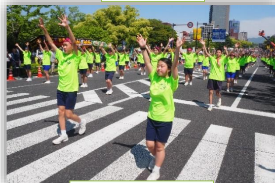
指先までしっかり伸びてます!