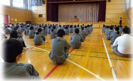
交通安全集会の様子

交通安全教室では、安全な横断の仕方や自転車の安全な乗り方について、世羅警察署の職員の方からご指導を受けました。