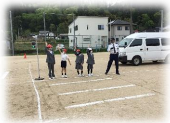
交通安全教室の様子

3年生をはじめ、他の学年の自転車に乗っている児童の様子を見ると、まだ十分に安全に乗れるとは言えない姿もありました。秋には、3年生が2回目となる自転車の乗り方などを学ぶ交通安全教室を行う予定です。3年生にはこの教室を経て、許可証（シール）を渡します。甲山小学校・甲山小学校P T Aでは「3年生以上の児童は、公道で自転車に乗ることができる」としています。しかし、一番大切なことは、保護者のみなさんの「我が子は、安全に自転車に乗れるようになった。」という判断です。ご家庭でも自転車等については、十分に交通安全に気を付けて利用するようにお願いします。