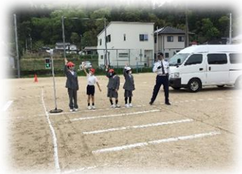
交通安全教室の様子

3年生をはじめ、他の学年の自転車に乗っている児童の様子を見ると、まだ十分に安全に乗れるとは言えない姿もありました。秋には、3年生が2回目となる自転車の乗り方などを学ぶ交通安全教室を行う予定です。3年生にはこの教室を経て、許可証（シール）を渡します。甲山小学校・甲山小学校PTAでは「3年生以上の児童は、公道で自転車に乗ることができる」としています。しかし、一番大切なことは、保護者のみなさんの「我が子は、安全に自転車に乗れるようになった。」という判断です。ご家庭でも自転車等については、十分に交通安全に気を付けて利用するようお願いします。