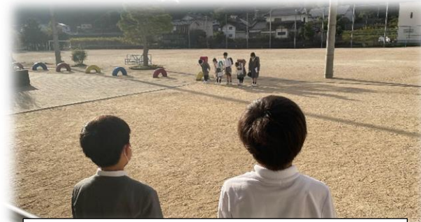
朝の登校時に、玄関であいさつ運動する児童会本部役員の児童2名

この他にも・・・ 「おはようございます。〇〇さん、後で一緒にあそぼうね！」 「さようなら。〇〇君また明日会おうね！」 「〇〇先生さようなら。今日は教室の時計を直してくれてありがとうございました。」 などと、その人ならではの一言をそえて表現できています。