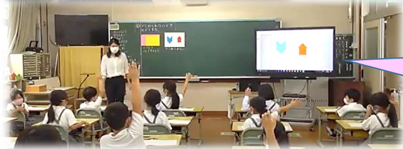
電子黒板を使って、発表をしようとしています。