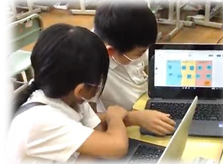
ジャムボードに貼った付箋の内容をペアで伝え合っています。