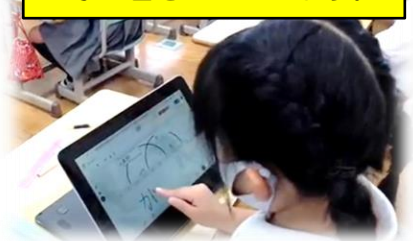
手書き機能を使って、文字を書きこんでいます。