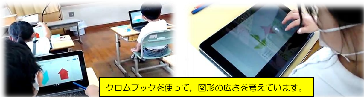
クロムブックを使って、図形の広さを考えています。