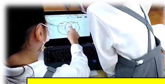
クロムブックを使い、ペアで考えを伝え合っています。