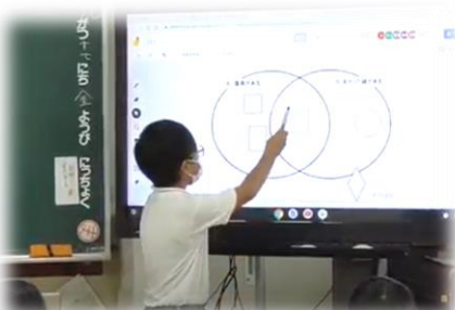
電子黒板で、自分の考えを説明しています。