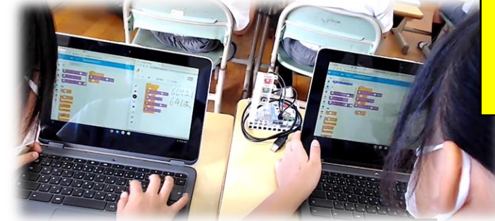
プログラミング教材の信号機をクロムブックにつないで、プログラムを入力し、イメージ通りに動くかを確認しています。