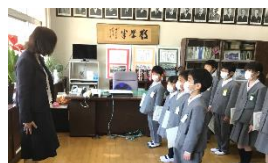
学級委員認証式 (4月9日) 校長室にて